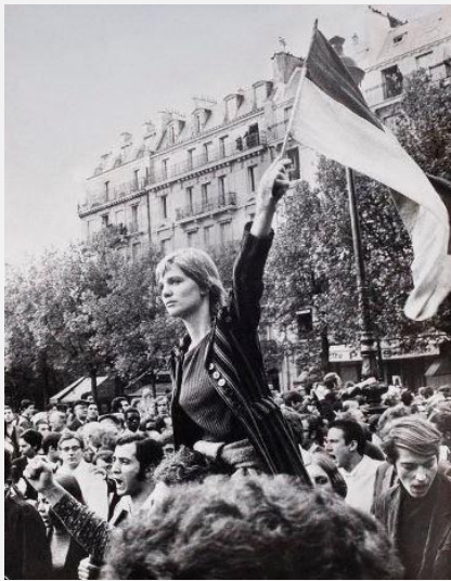
La Marianne de Mai 68

Pour finir sur une note de Curiosité et Inspiration